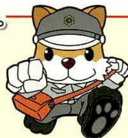
イメージキャラクター太助